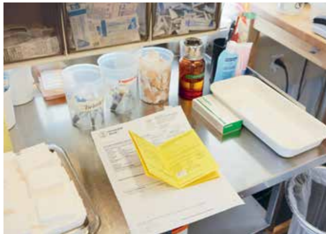
Die Reisemedizin konzentrierte sich bisher auf Infektionskrankheiten wie Malaria. Jetzt kümmert sie sich auch um die Vorbeugung gegen andere gesundheitliche Probleme auf Reisen.

informieren Herzpatienten, wie sie ihre Reiseroute planen können, um gesundheitlichen Problemen vorzubeugen.